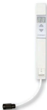
LAVA®-R Thermostat mit Stecker