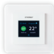
eTOUCH ECO mit Touchpad