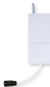
LAVA®-F Funkempfänger mit Stecker