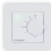
eTWIST BASIC mit App-Funktion