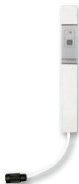
LAVA®-T Timer mit Stecker