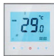
eNEXHO-CL Funkbus Raumthermostat