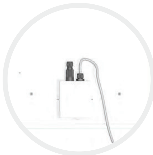
Plug&Play-Box an der Rückseite